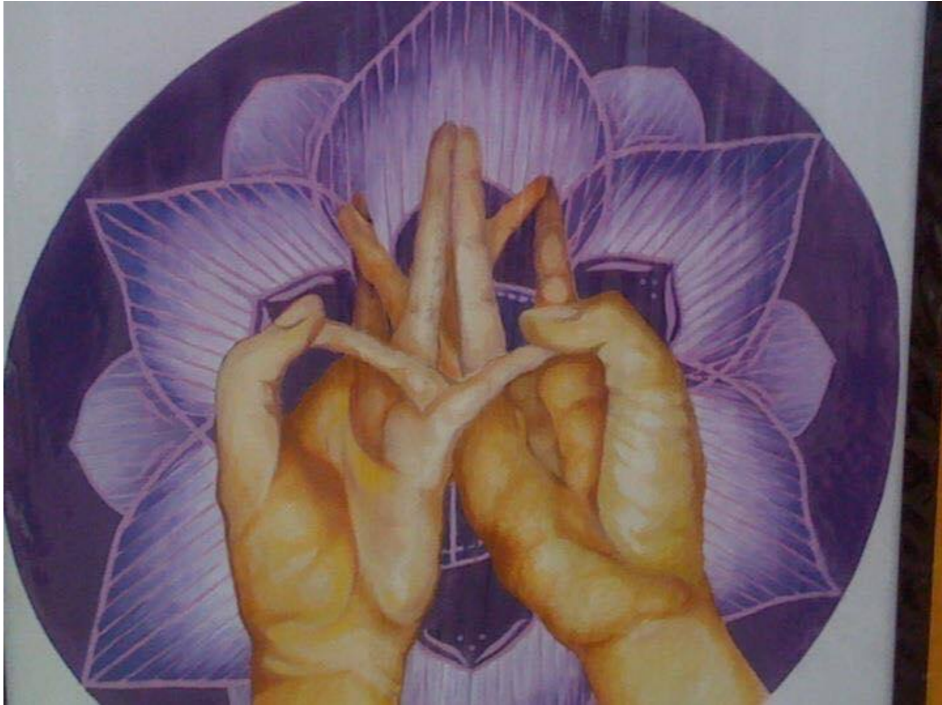
Mudra de ofrecimiento del mandala

Con compasión, por favor concedan sus bendiciones, ¡lo ruego!