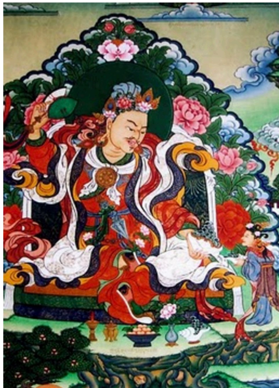
Padma Tötreng Tsal y todos los vidyādharas de la India y el Tíbet (de México y el mundo)