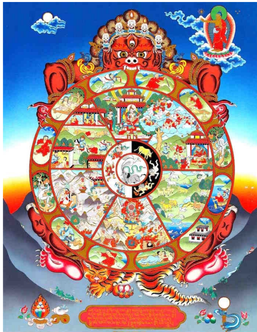
The Wheel of Life